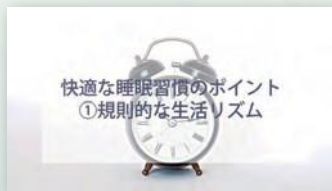
快適な睡眠習慣のポイント ①規則的な生活リズム