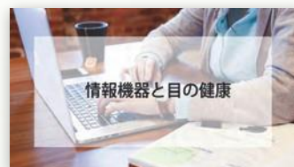
情報機器と目の健康