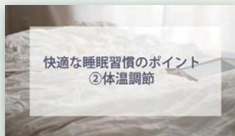
快適な睡眠習慣のポイント ②体温調節