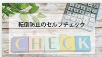
転倒防止のセルフチェック