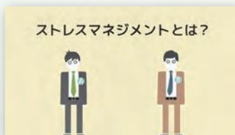
ストレスマネジメントとは？