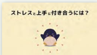
ストレスと上手に付き合うには？