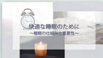
快適な睡眠のために ~睡眠の仕組みと重要性~