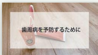
歯周病を予防するために