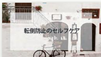
転倒防止のセルフケア